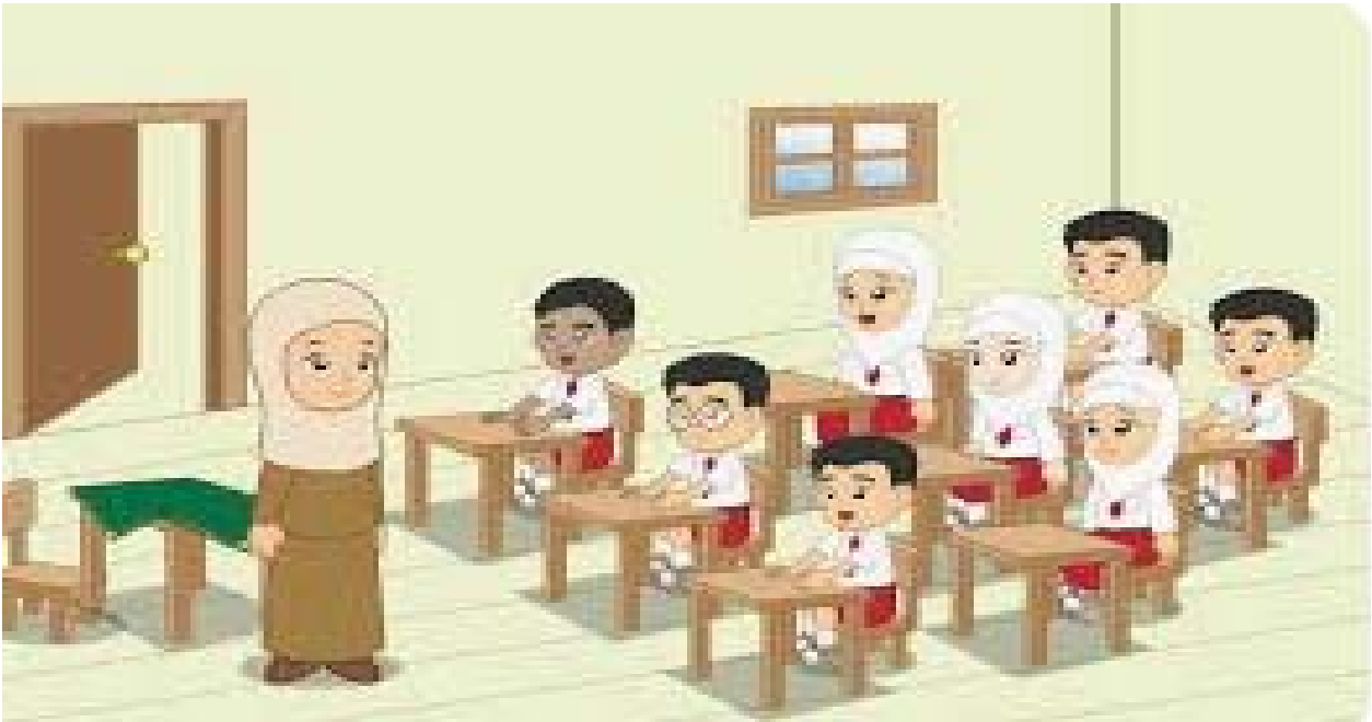
Gambar 1.2