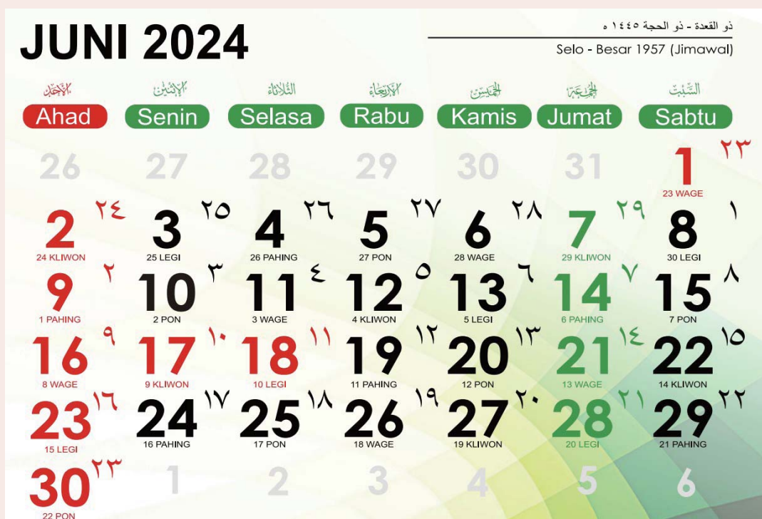
Gambar 1.1 https://s.id/contohkalender

Tau be iko karan karan olo suang lemanak?