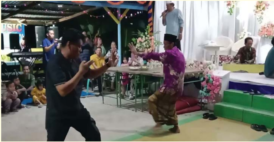
Gambar 1.1 Mamukite Kuntau Paser